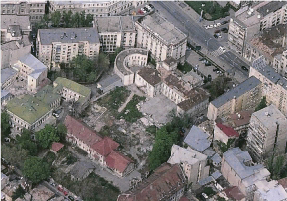
Sursa: http://art-historia.blogspot.com - Vedere aeriana amplasament anul 2007