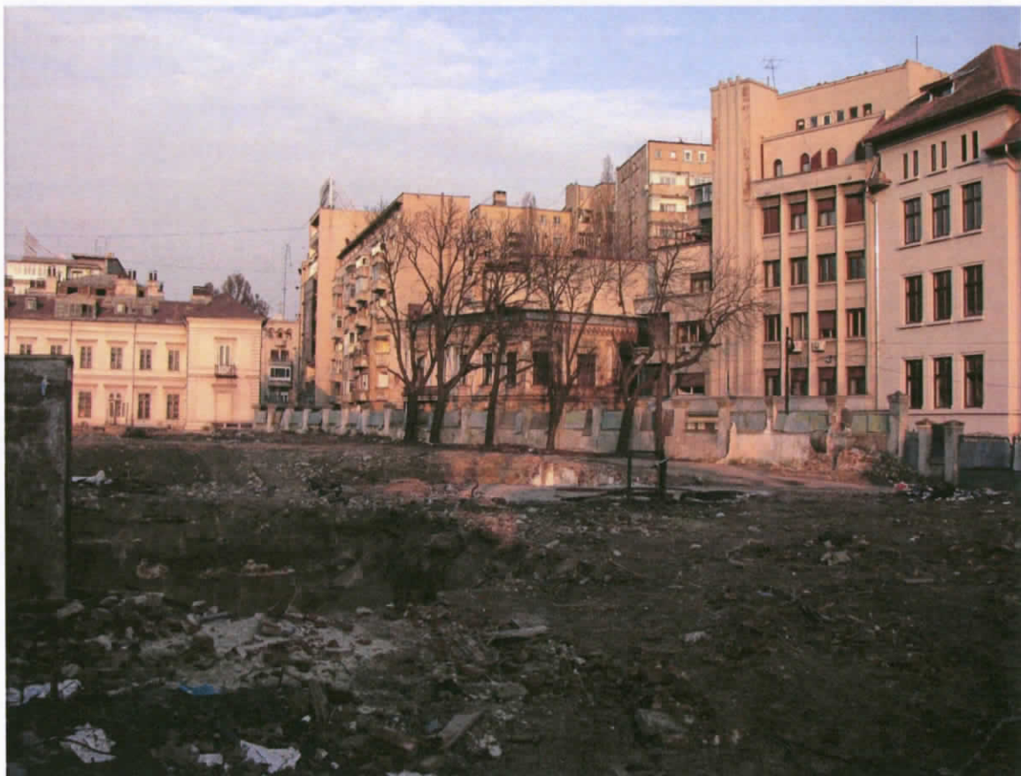
Vedere amplasament anul 2008